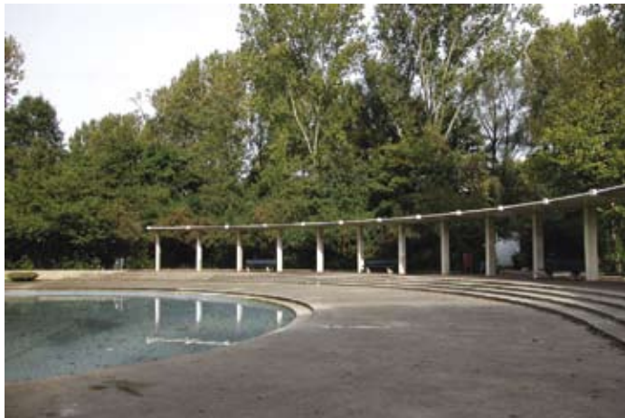
Badje met pergola en heesterstrook.