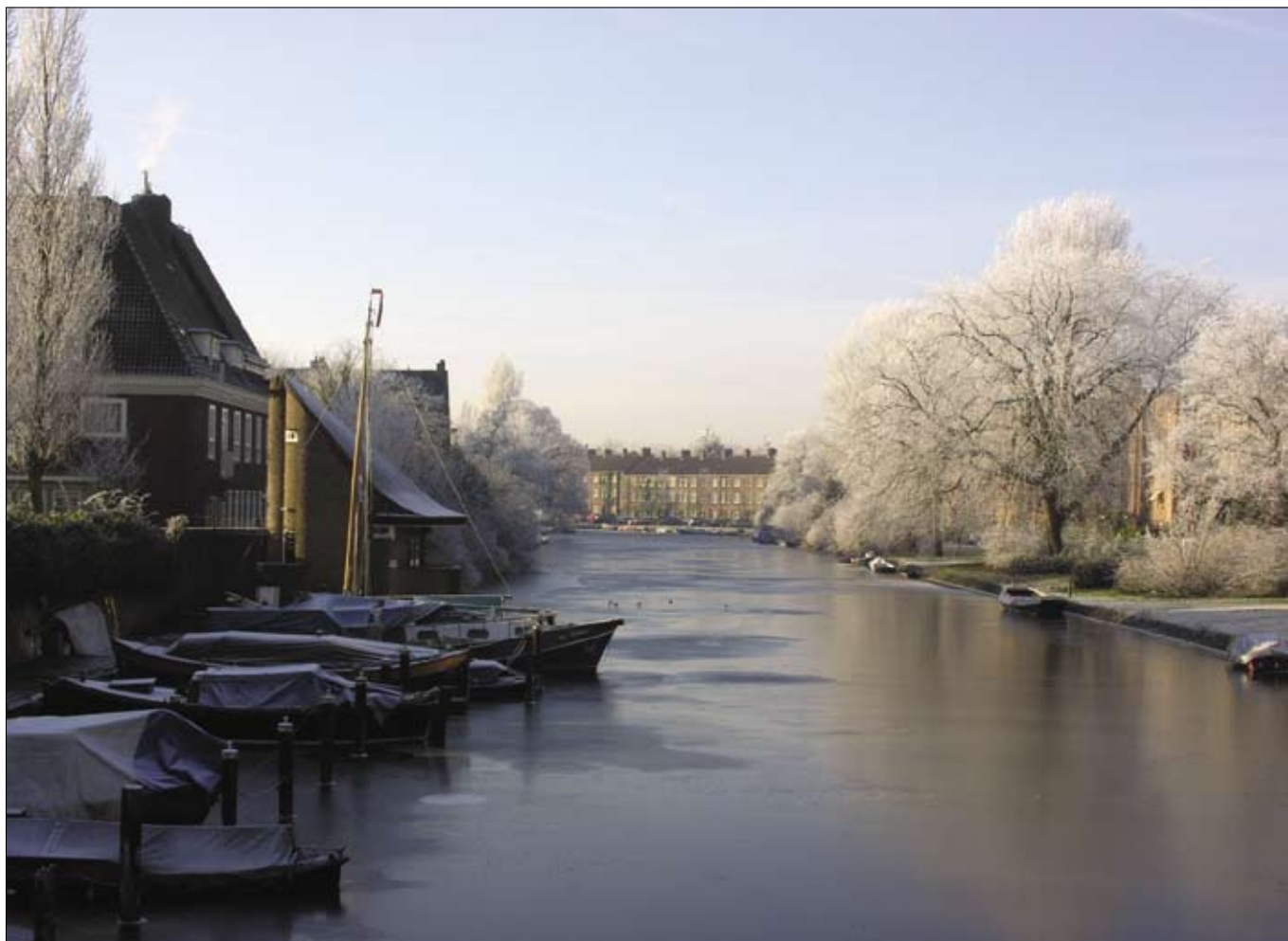
Het Noorder Amstelkanaal in winterkleed.

NIEUWS UIT DE HOOFDDORPPLEIN-, SCHINKEL-, BEETHOVEN- EN STADIONBUURT